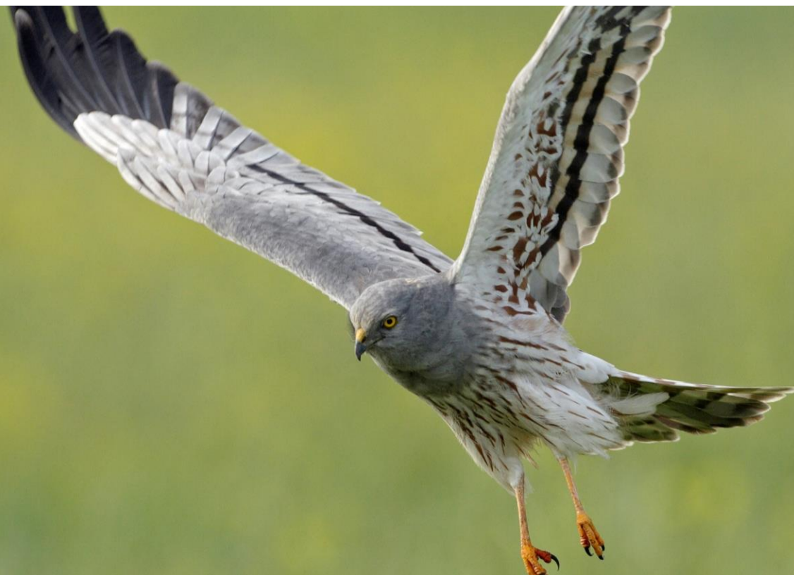
Busard cendré mâle