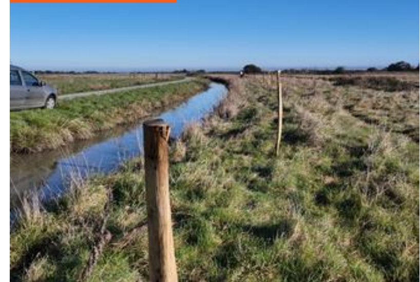
Protection roselières