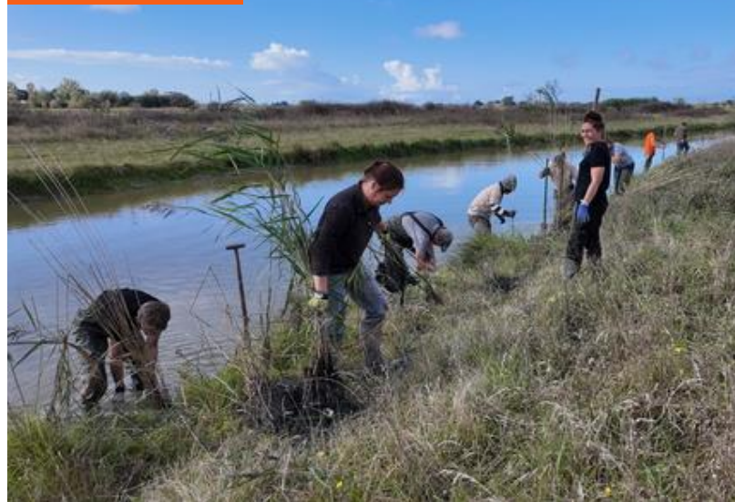
Plantation roselières