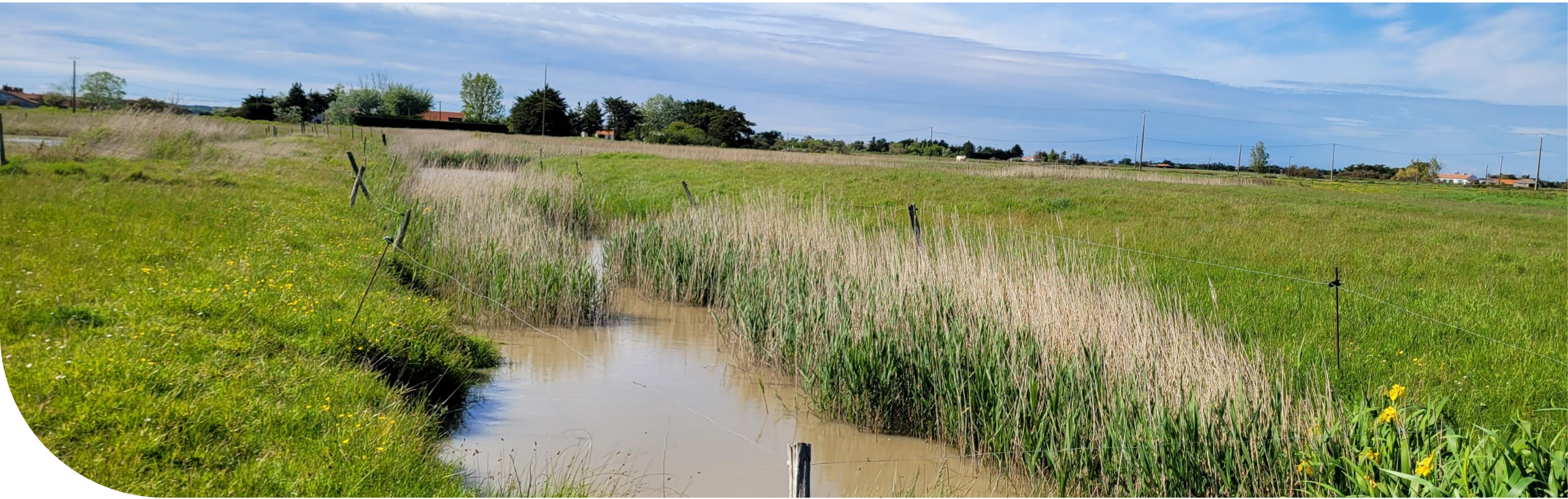
Roselière protégée