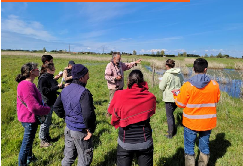
Temps d'échanges roselières