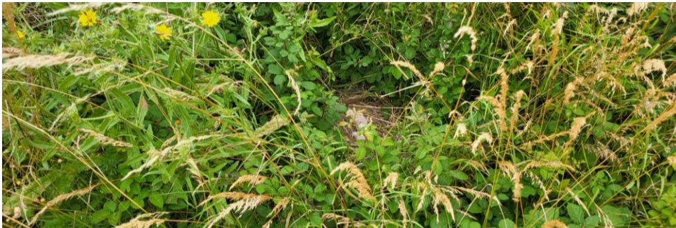
Nid de Busards cendrés protégé en 2024