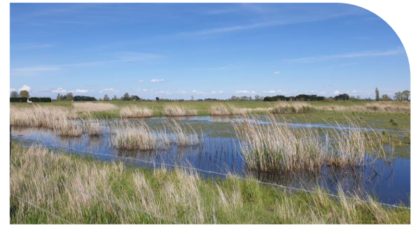
Roselière plantée en 2022

Intérêt écologique (berges, qualité eau,...)